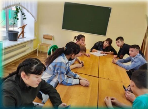
«Эверест» үйірмесі “жаяу туризм” багыты