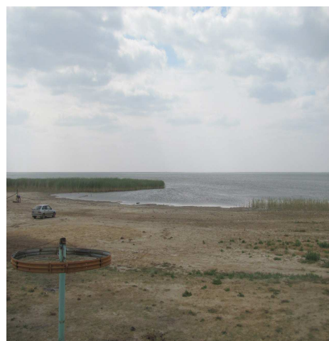
Сакрыл көлі (Ақкөл)