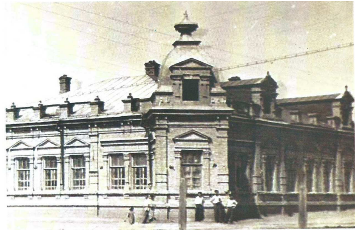
Овчинниковтардың қызыл кірпіштен салған негізгі үйі. 1904 ж

1870 жылдардан бастап, Жайық бойынан Қараөзен - Жалпақтал өңіріне Карповтар, Калпаковтар, Егоровтар, Масьяновтар және тағы басқа да орыс - казактары көшіп келіп қоныстанды. Міне олардың қатары көбейген сайын қазақтар мен келімсектер арасында жер - су дауы басталды, жалғасты.