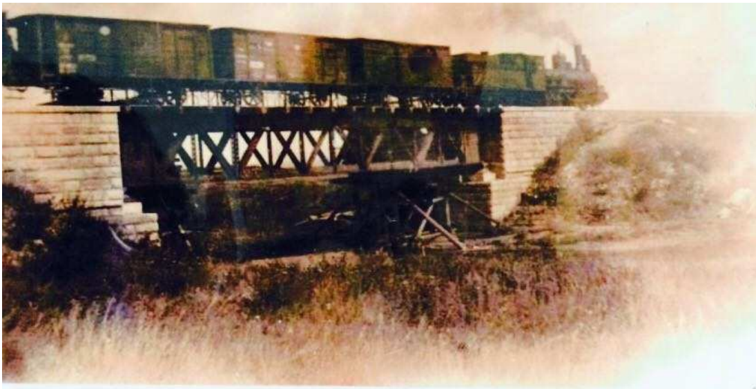
Алға – Эмба теміржолы (Сламихиннан 2 шақырым) 1921 ж

1919 жылдың 2 -ші жартысында большевиктік биліктің серкесі В.И.Лениннің қолы қойылған декрет шығып Алға – Эмба темір жолының құрылысы басталды. Қазақ жеріндегі Эмба өзені алқабындағы мұнайды Ресейдің орталығына жеткізуді көздеді. Ленин бұл құрылысты ең бірінші коммунисттік құрылыс деп атап қыс жағдайында құрылысты бастап кетуді талап етті. «Александр Гай» теміржол станциясынан бастау алған құрылыс Жалпақтал өңірінің аумағы арқылы темір жолды Эмбаға дейін жеткізіп, 1921 жылы аяқтау жоспарланды.