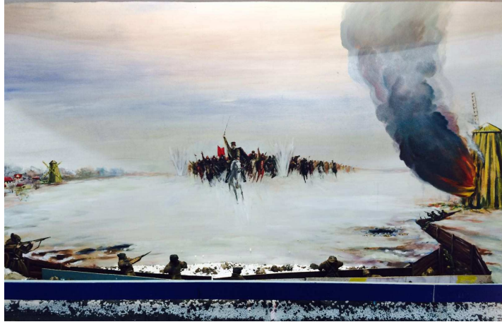
Сламихин шайқасы (Понарама) 1919 жыл 10 наурыз

1919 жылдың 2 -ші жартысында большевиктік биліктің серкесі В.И.Лениннің қолы қойылған декрет шығып Алға – Эмба темір жолының құрылысы басталды. Қазақ жеріндегі Эмба өзені алқабындағы мұнайды Ресейдің орталығына жеткізуді көздеді. Ленин бұл құрылысты ең бірінші коммунисттік құрылыс деп атап қыс жағдайында құрылысты бастап кетуді талап етті. «Александр Гай» теміржол станциясынан бастау алған құрылыс Жалпақтал өңірінің аумағы арқылы темір жолды Эмбаға дейін жеткізіп, 1921 жылы аяқтау жоспарланды.