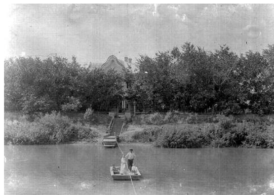
Қараөзеннің арғы бетіне