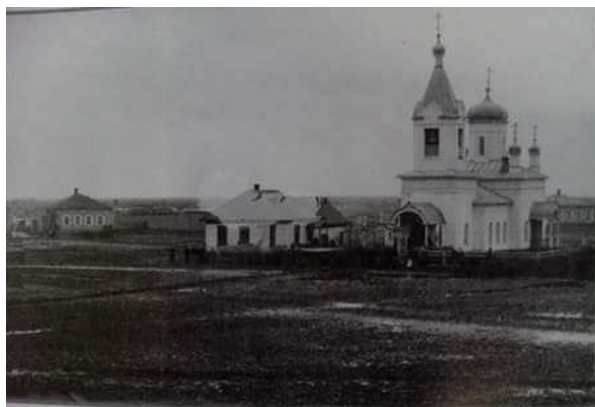
Сламихин станицасындағы Покров церковы 1896