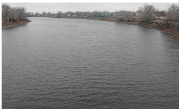
Қараөзен өзен арнасы

Қос өзен : Қараөзен, Сарыөзен – Еділ , Жайық аралығы. Екі су алқабында қатарласып орналасқан . Ара – қашықтығы 50 – 60 , кей тұста 10 – 15 шақырым мөлшерінде.